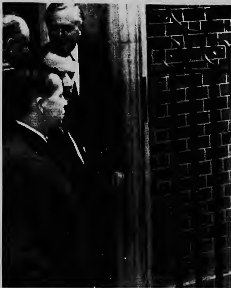
Cu un sonrisa grandi riba su cara prome minister Harold Wilson -- cu cara pa camera -- ta combersa cu prome minister sovietico Alexei Kosygin despues di un reunion na su cas. Kosygin lo keda un siman na Londres.

"Di ningun manera nos no ta tecnologicamente mas pober cu Merca. Al contrario; den algunos ainda nos ta mas avanza cu nan."